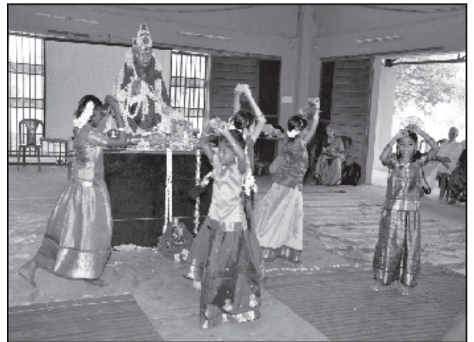
Cultural Item - Students of DMS Centre